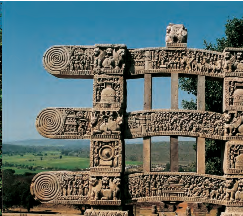
Boven: De oostelijke toegangspoort van de Sanchi-stoepa. Rechts: De Boeddha die het mahaparinirvana binnengaat, rotstempel 26 in Ajanta, 5e eeuw n. Chr.

Monniken, na mijn overlijden zal het gebeuren dat mensen een ommekeer maken rond deze plaatsen en dat ze zich in het stof laten vallen.