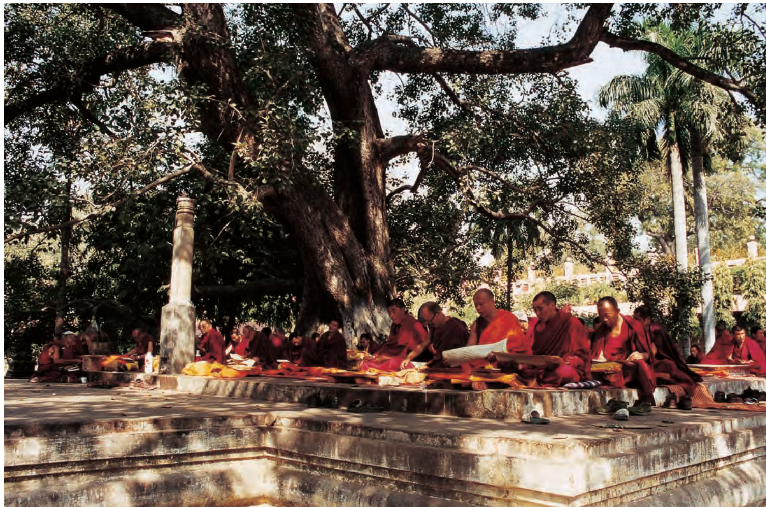
Tibetaanse monniken zeggen teksten op in de buurt van de bodhiboom.

Ondanks het feit dat het boeddhisme ooit wijd was verspreid door heel India, met een rijke culturele ontwikkeling als gevolg, onderging het op den duur het lot van alle bestaande dingen en raakte het langzaam in verval, zelfs in het land van oorsprong. Wat we nu kennen als het hindoeïsme kwam krachtig terug, maar nam daarbij veel boeddhistische elementen in zich op, zodat het boeddhisme in het zuiden geleidelijk wegstierf. In het noorden speelde zich een soortgelijk proces af door de agressieve komst van de islam. De boeddhistische kloosters waren een gemakkelijk doelwit voor de nietsontziende plundersaars. Aan het begin van de 13e eeuw was er weinig over van het boeddhisme, afgezien van wat volkstradities in afgelegen gebieden. Tegenwoordig is India nog altijd zeer interessant en aantrekkelijk voor boeddhisten van alle richtin-