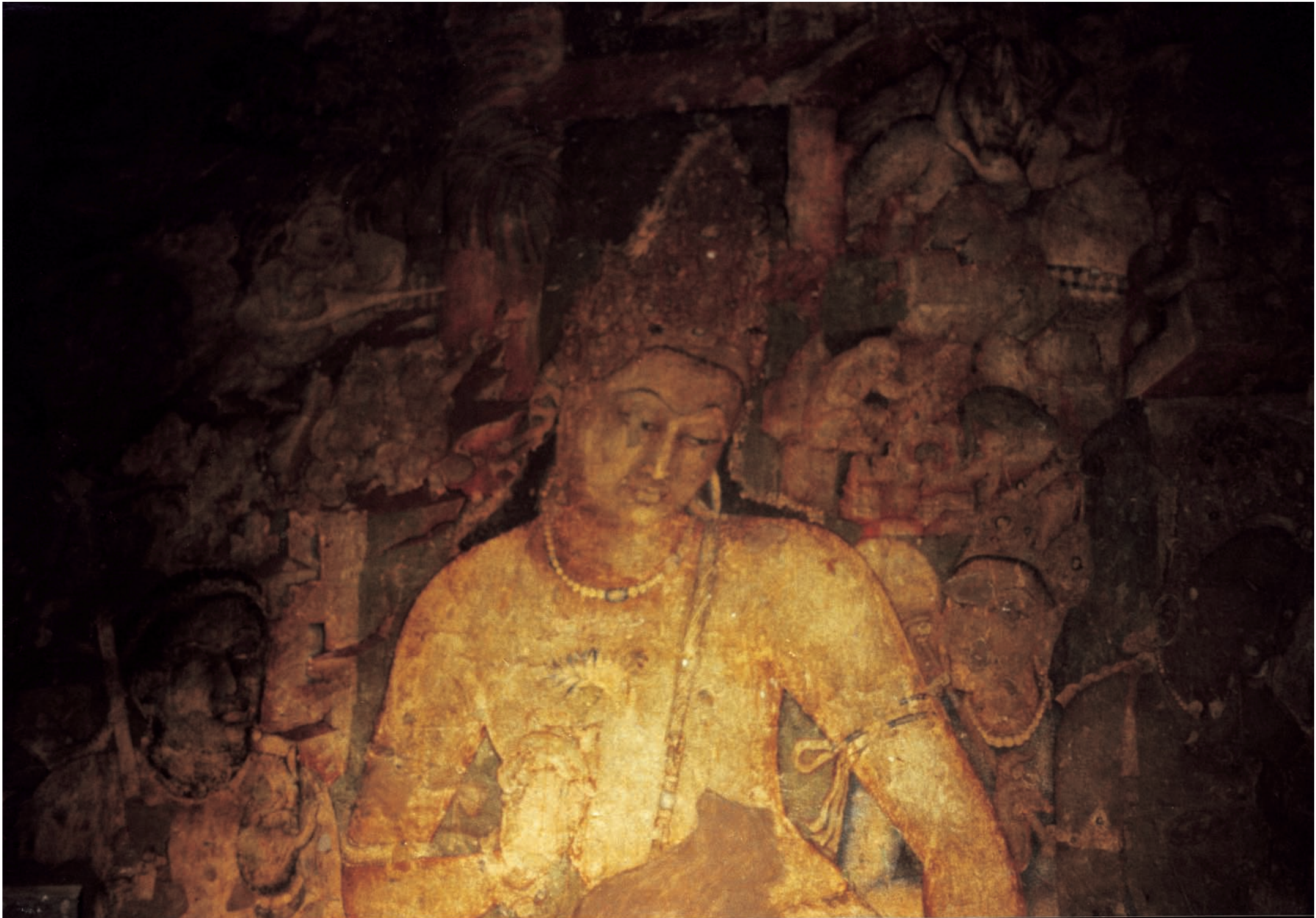
De bodhisattva Padmapani met een lotusbloem, op de muur van de grothol van grot 1 in Ajanta, 7e eeuw n. Chr. Unesco-monument.

dhisten die volgelingen zijn van Dr. B.R. Ambedkar. Hij was een vooraanstaand leider van het pas onafhankelijke India die in het boeddhisme een mogelijkheid zag voor de kaste van 'onaanraakbaren' om het stigma van hun geboorte af te werpen. De andere gemeenschap bestaat uit de boeddhisten van het Himalajagebied, die al generaties lang behoren tot het Tibetaanse boeddhistische cultuurgebied. Ondanks het betrekkelijk kleine aantal Indiase boeddhisten wordt het boeddhisme als manier van leven en als onderdeel van de nationale geschiedenis en cultuur nog altijd op brede schaal gerespecteerd in het land waar het ooit ontstond.