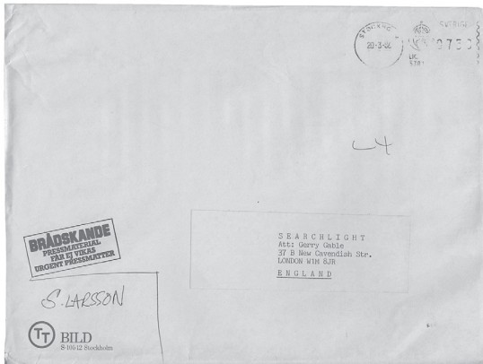
Stieg Larssons brief aan Gerry Gable, geschreven in het Engels op 20 maart 1986.

Verbijsterend door de wijze waarop de geschiedenis plotseling een andere wending neemt, alleen maar om voor de volgende deadline opnieuw van richting te veranderen. Ongelooflijk door de omvang van de politieke gevolgen; ik geloof dat het voor het eerst in de geschiedenis is dat een staats-hoofd is vermoord zonder dat men ook maar een idee heeft wie het gedaan heeft. Onbehaaglijk - moord is altijd onbehaaglijk - omdat het slachtoffer de premier was, in Zweden een ontegenzeggelijk geliefd en gerespecteerd iemand, ongeacht of je toevallig sociaaldemocraat bent of niet (zoals ik).