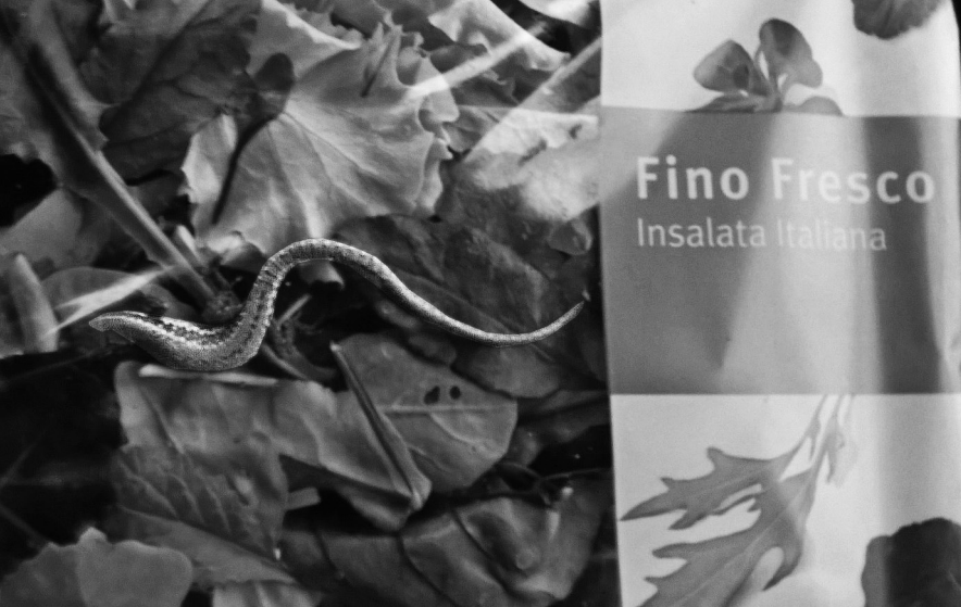
De muurhagedis in de sla, meegelijft uit Italië.