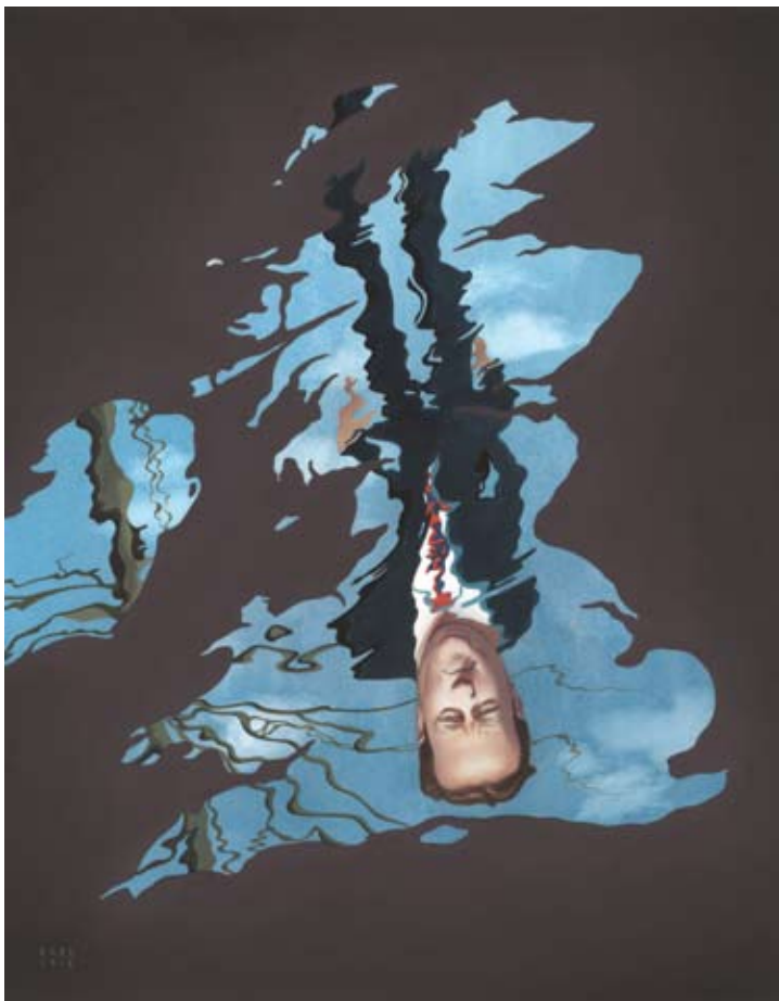
Het verdronken land van Cameron

De illustrator worstelt bovendien, net als elke andere journalist, met deadlines. De inspiratie voor de tekening komt van de actualiteit, maar die is erg vluchtig. Wanneer de tekening verschijnt, kunnen de feiten al vervlogen zijn, waardoor de pointe de lezer of de toeschouwer ontgaat. Het is dus vaak op een slappe koord dansen. Welk onderwerp zal de actualiteit langer dan enkele dagen beroeren, en kan voor inspiratie zorgen? Of nog, hoe lang moet een Ebolacrisis woeden eer de tekenaar er een tekening aan wijdt?