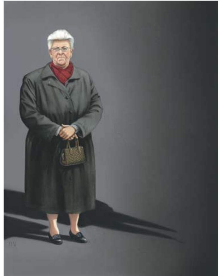
Jean-Luc Dehaene 1940-2014